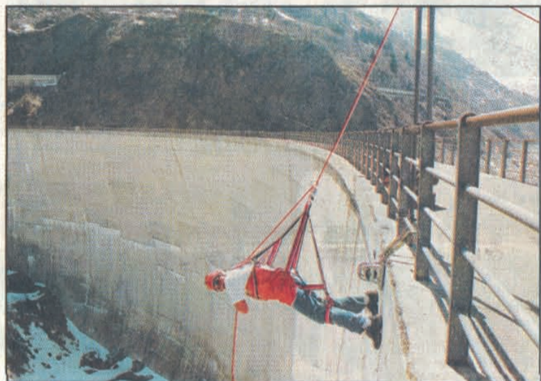
Le Rap Jump – descente en rappel le long d'un barrage – est l'une des dernières activités inscrites au programme de No Limits Canyon.

NO LIMITS CANYON ► La société installée aux Marécottes bénéficie de plusieurs certifications, dont le label Valais Excellence. Qualité des prestations et sécurité pour le client sont au cœur de la philosophie de l'entreprise.